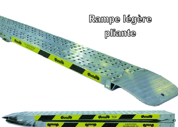
Rampe légère pliante

Vente de matériels pour le bâtiment, levage, nettoyage - Maintenance - SAV